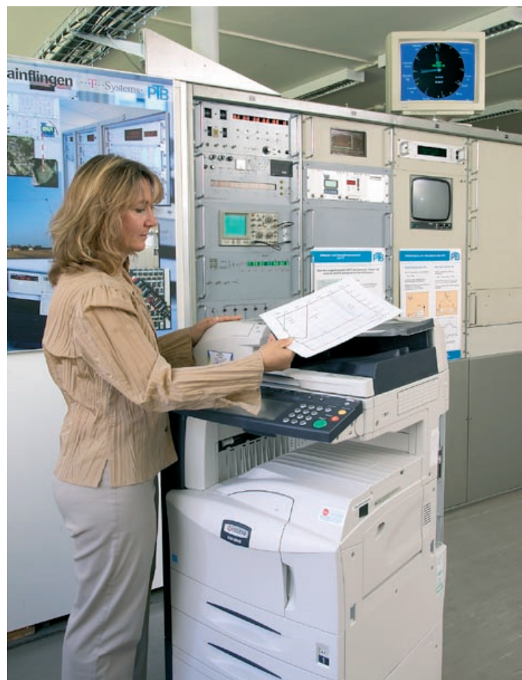
Eine PTB-Mitarbeiterin beim Scannen am KM-3050.

Die interne Dokumentenbox des KM-3050 erfüllt gleich mehrere praktische Funktionen. Zum einen kann sie für den personalisierten Druck genutzt werden. Dazu vergibt der Anwender vor dem Ausdruck im Treiberfenster seines PCs einen Pincode. Die Druckdateien werden dann in der Dokumentenbox gespeichert, bis der Anwender den Pincode am System wieder