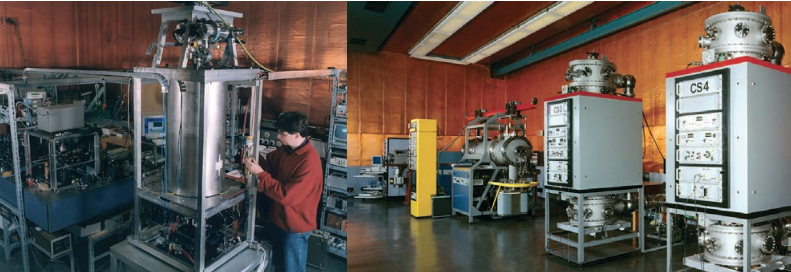
Die Atomuhr in der Uhrenhalle der PTB.

In der Uhrenhalle der Physikalisch-Technischen Bundesanstalt (PTB) in Braunschweig „ticken“ die berühmten Cäsium-Atomuhren. Mit einer Abweichung von weniger als einer millionstel Sekunde pro Jahr sind sie nicht nur die genauesten Uhren Deutschlands sondern durch sie wird auch die Weltzeit mitbestimmt. In der PTB wird jedoch nicht nur die Zeit gemacht – sondern auch der Meter, das Kilogramm, das Newton sowie das Volt. Die Anstalt ist das nationale Metrologieinstitut und damit oberste Instanz bei allen Fragen des richtigen und zuverlässigen Messens. Eine solch hochtechnische Organisation benötigt natürlich für die 1.400 Mitarbeiter IT-Lösungen auf höchstem Niveau.